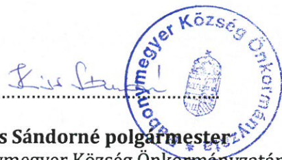
Kiss Sándorné polgármester Bábonygyer Község Önkormányzatának képviselésében