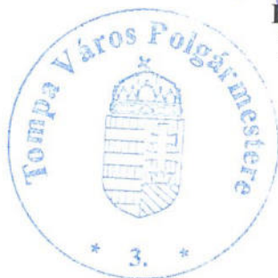
Kovács Gábor Polgármester