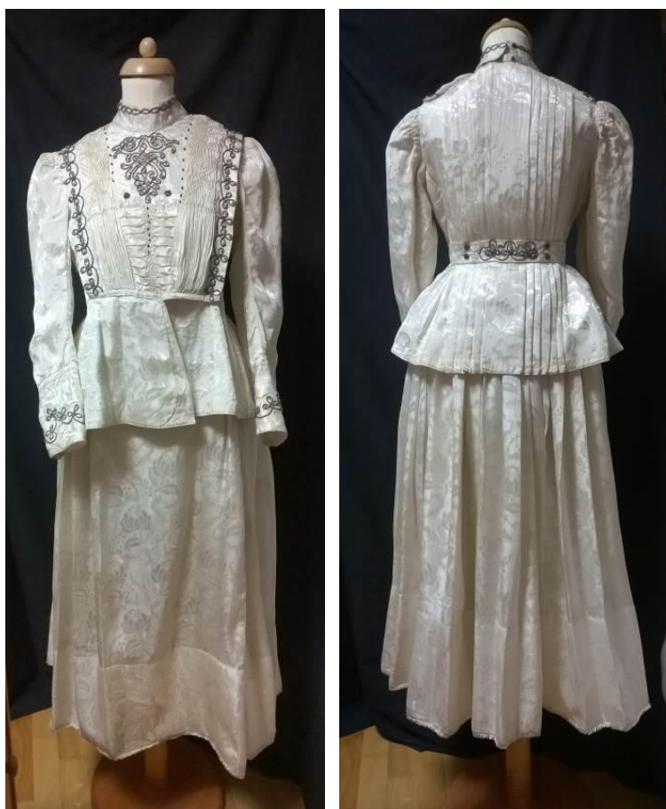
5., 6. kép. Az elkészült viselet bábúra helyezve