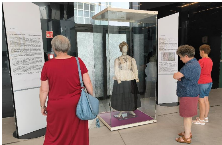
7. kép. A viselet bemutatása

A restaurált viselet 2025 júliusában, a Szent István Király Múzeum központi épületének („Rendház”) fogadóaulájában „A hónap Műtárgya” tematikájú időszak kiállításán lett bemutatva (7. kép). A kiállítóvitrin szomszédságában két ismertetőszöveg is ki lett helyezve, melyek a felsővárosiak népszokásairól, illetve a restaurálás menetéről adtak bővebb információt a látogatóknak (8. és 9. kép, illetve 1. és 2. sz. melléklet). Egy nagyméretű kijelzőn pedig archív esküvői fotókból és a restaurálás közben készült munkafotókból összeállított diavetítés volt látható (10. kép). A kiállításához természetesen plakát is készült (3. sz. melléklet).