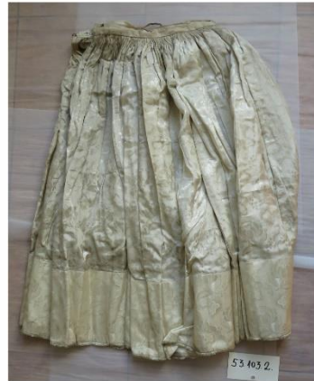
A viselet restaurálás előtti állapota