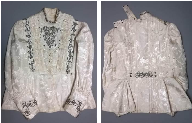
3., 4. kép. A restaurált felsőrész elő- és hátoldala

érvényesült a minimális beavatkozás elve. A 3., 4., 5. és 6. képen a viselet restaurálás utáni állapota látható.