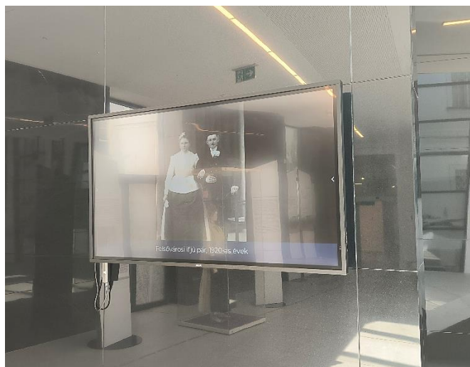
10. kép. A kijelzőn futó archív fotók egyike