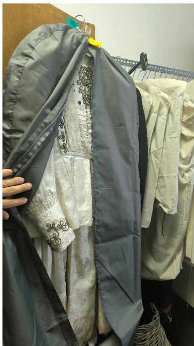
11. kép. Védőhuzat

A menyasszonyi viseletet az Országzászló téri épületünkben lévő néprajziraktárunkban raktározzuk. A ruha tárolása formázott vállfán, porvédő huzatban történik (11. kép). A raktárhelyiség hőmérséklete éves ciklusban 18 és 25 °C közötti. A levegő relatív nedvességtartalma jellemzően: 45-55%.