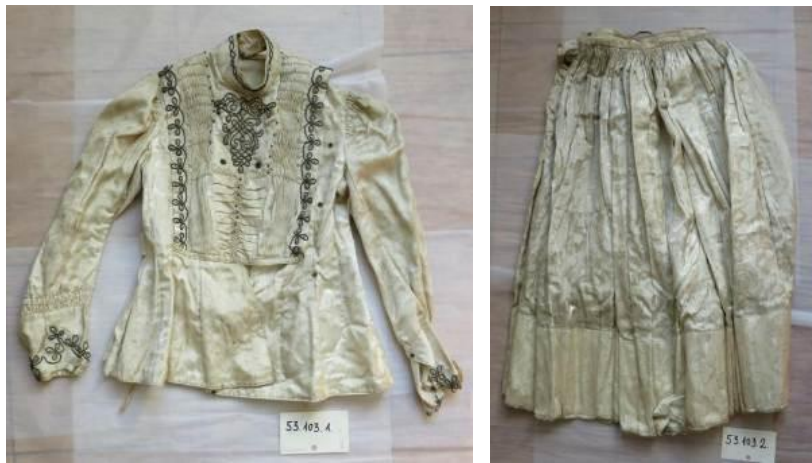
1.,2. kép. A viselet restaurálás előtti állapota

A viselet évtizedeket töltött el gyűrött és poros állapotban a néprajzi raktár egyik polcán, falárába csomagolva. A szövetek ez idő alatt egy kissé merevvé és rideggé váltak (1. és 2. kép). Különösen a nyaknál, a kézelőnél, a szoknya derekánál és alsó szélénél foltos elszíneződések is megfigyelhetők voltak. A fémfonals rátétdíszítéseket szürkés korrózió borította. A gyöngyök porossá és tompafényűvé váltak. A szövetszélek sok helyen foszlottak, szakadozottak lettek.