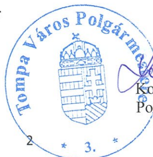
Kovács Gábor Polgármester