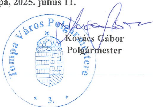
Kovács Gábor Polgármester