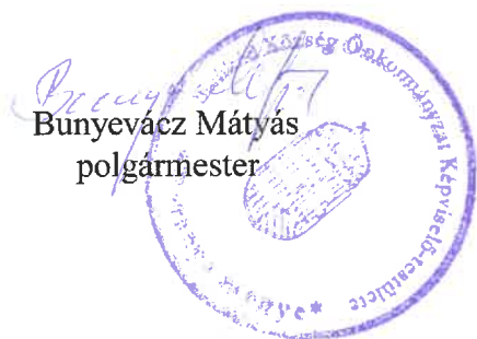
Bunyeváczy Máttyás polgármester