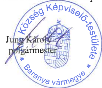
Jung Károly polgármester

Ez a rendelet a kihirdetését követő napon lép hatályba.