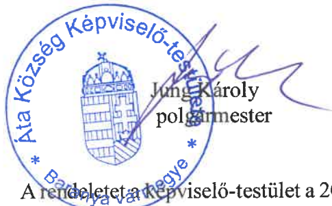
JUNG Károly polgármester

Ez a rendelet a kihirdetését követő napon lép hatályba.